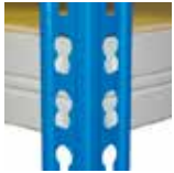
Замок с зацепами