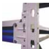
Крепление балок к стойкам