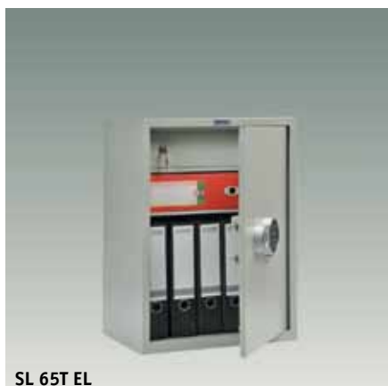
SL 65T EL