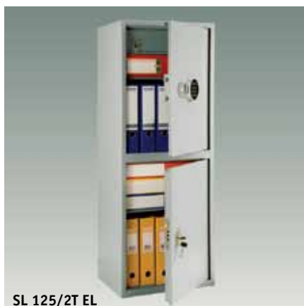
SL 125/2T EL