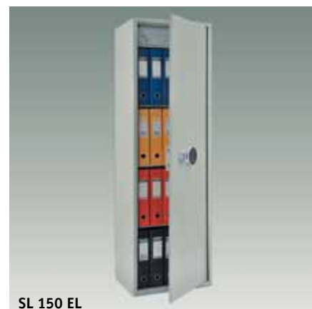
SL 150 EL